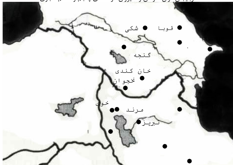
شهرهای مهم آذربایجان ایران و آذربایجان قفقاز