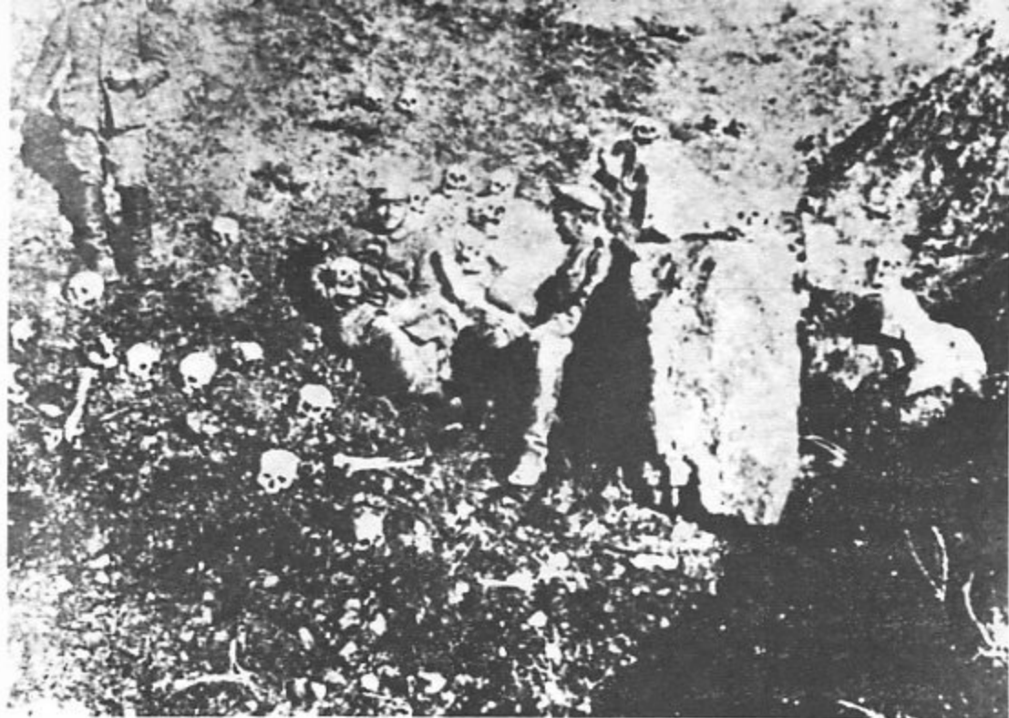
قتل عام طرابوزان