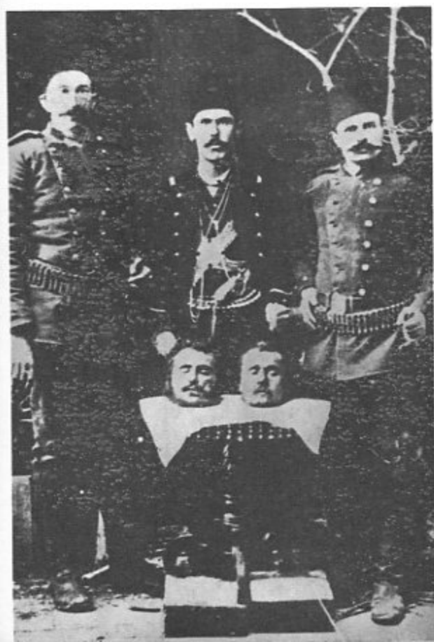
سرهای بریده دو ارمنی عضو عالی مقام دولت عثمانی.