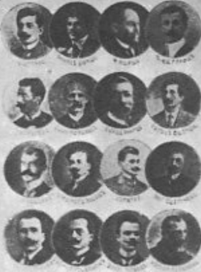
Բեիրան ՀԻԶԲ ԴԱՏՆԱԿ ԿԵ ԴՐ 1915 ԴՐ ԵՐԾՄԱՆԻ ԿՏԻՏԵ ՏԻԴՆԴ.