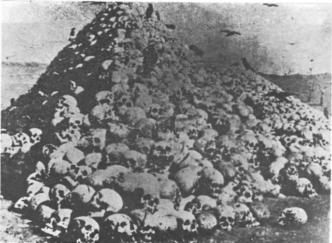
سرهای آرامنه‌ای که قتل عام شدند در سال ۱۹۱۷