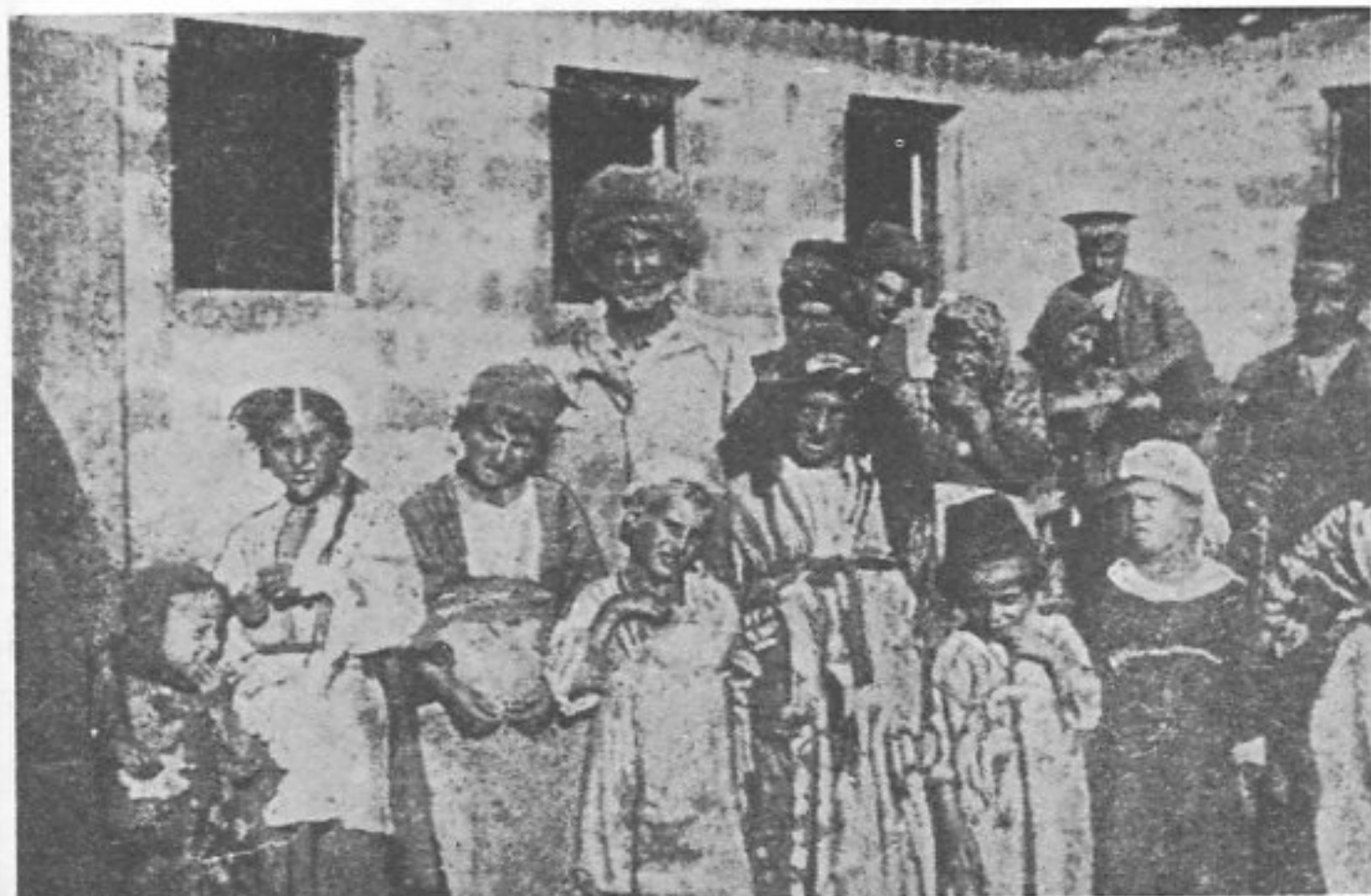
ՇՆԴ ԶՆ ՈՐԴ ԱՐՄՆԻ ԱՏԻՐ ՔԻԼ ԱԶ ԿՏՏԱՐ ԴՏԻՏԵ ՇՄԵՐԻ