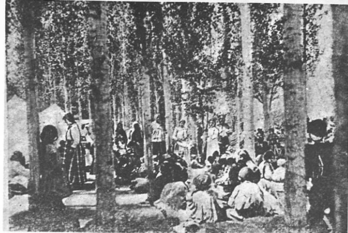
کودکان، پیرمردان و پیرزنان ارمنی قبل از این که آنان را به داخل دریاچه وان بریزند.